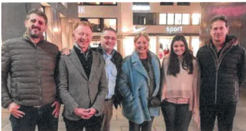
Kerngruppe beim Abendprogramm in Vaduz

Die Thesen sind in drei Phasen unterteilt, jeder Phase wurden zwei Hypothesen zugeordnet, diese lauten wie folgt: