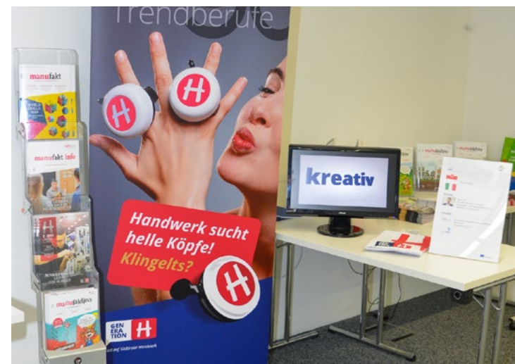
«Kick off Meeting» in Ruggell (Li)