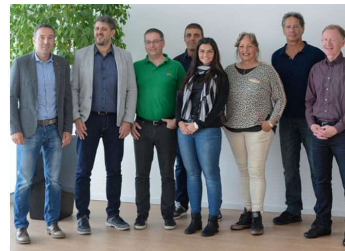
«Multiplikatoren- Veranstaltung» in Zug