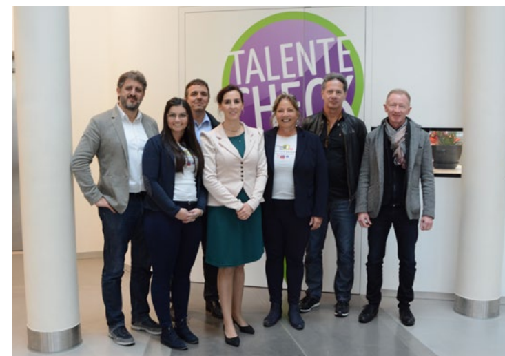
«Kick off Meeting» in Ruggell (Li)