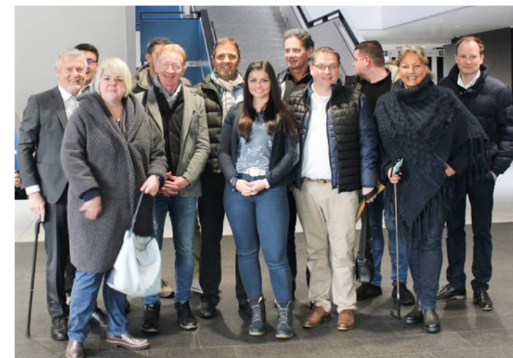
«Kick off Meeting» in Ruggell (LI)