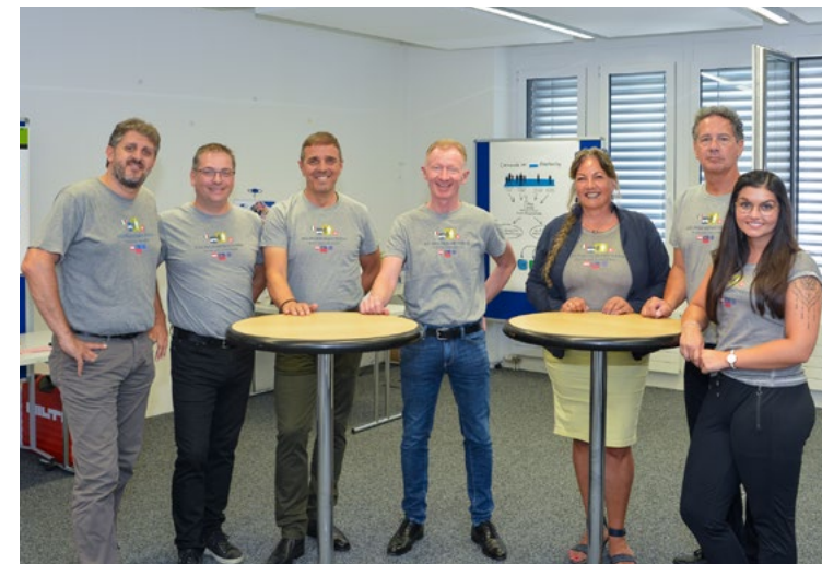
«Multiplikatoren- Veranstaltung» in Zug