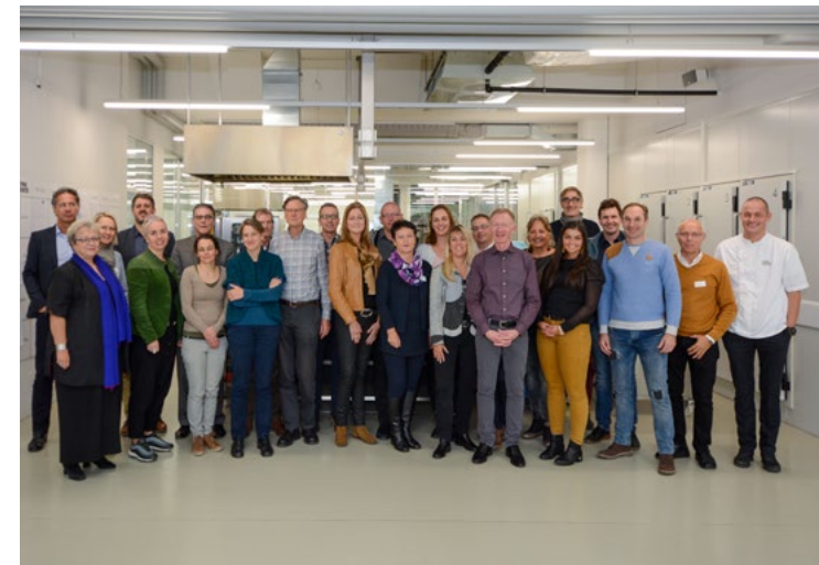
«Multiplikatoren- Veranstaltung» in Zug